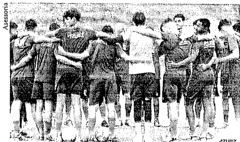
Após despachar o Operário na semifinal, sub-17 do Azuriz decide o Campeonato Paranaense contra o Athletico-PR.